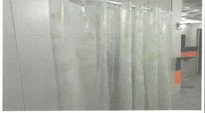
수영장 여자샤워실 화장실 임시 커튼설치