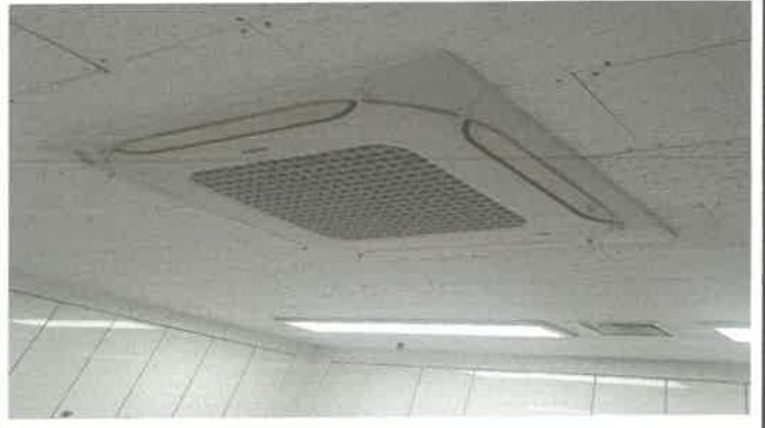
수영장 남자탈의실 에어컨주변 오염텍스 교체