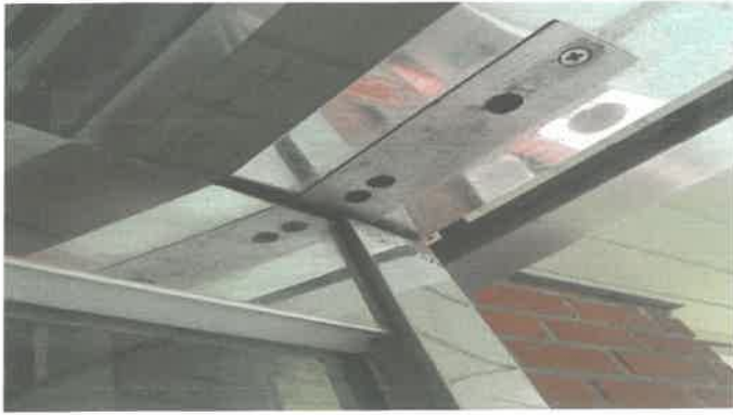
1층 출입강화문 상부힌지 조정