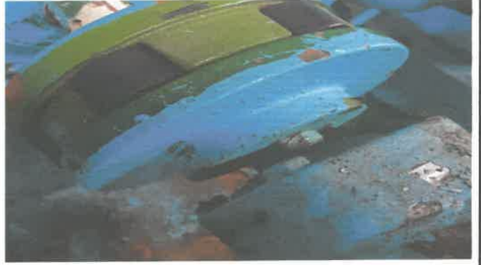
고가 급수펌프1호기 바킹 교체