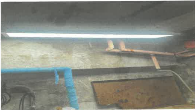
수영장 비트 바란싱탱크 상단 전등교체